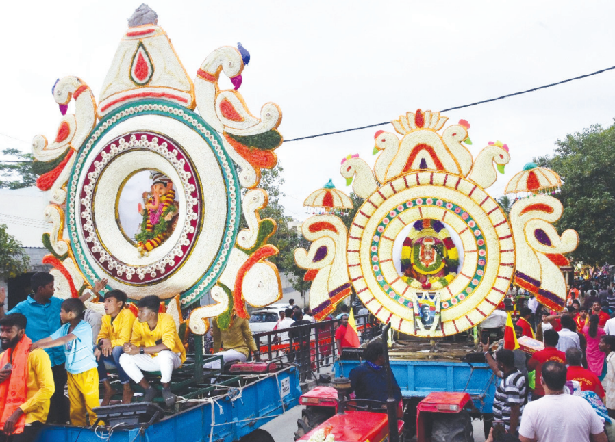
ಬೆಂಗಳೂರಿನ ಬಾಣಸವಾಡಿಯ ಸುಬ್ಬರಾಯನಪಾಳ್ಯ ಗ್ರಾಮದಲ್ಲಿ ಒಂದು ಹಬ್ಬದ ಪ್ರಯುಕ್ತ ನಡೆದ ರಥೋತ್ಸವದಲ್ಲಿ ನೂರಾರು ಜನರು ಪಾಲ್ಗೊಂಡಿದ್ದರು.